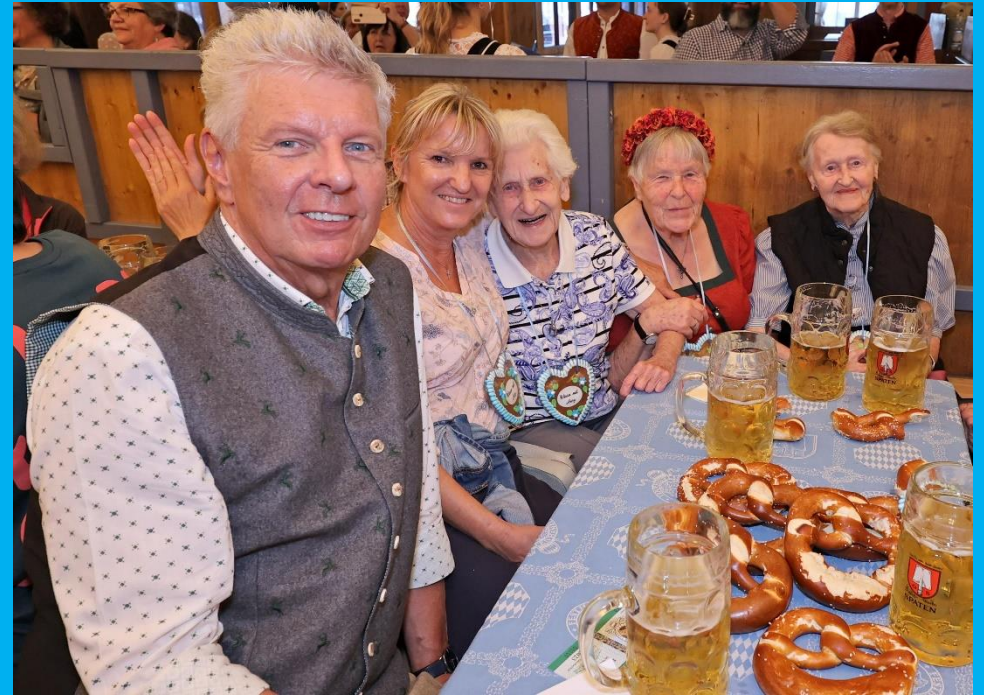
Oberbürgermeister Dieter Reiter auf der Wiesn mit Herz

Fachforum der Mitgliederver- sammlung des Gesunde Städte Netzwerks am 01.10.2024